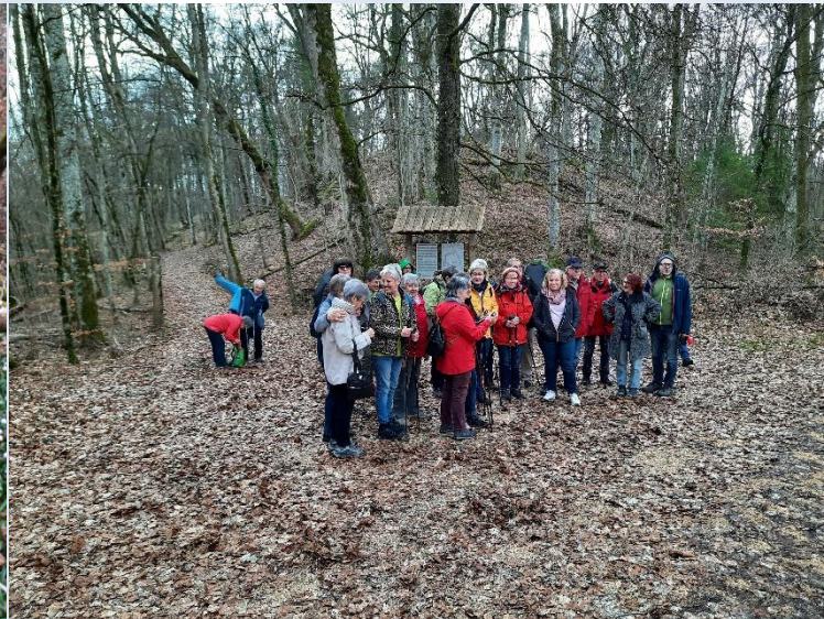
Bilder vom Jahr 2023 bei der Märzenbecherwanderung bei Upflamör